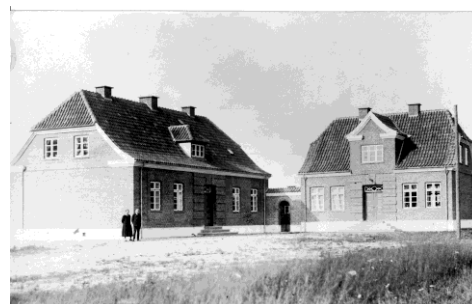
Gårde skole på Johnsgårdvej

Fra 1877 var der en biskole i Bredho. den blev i 1908 hovedskole med en enelærer og vinterlærerinde.