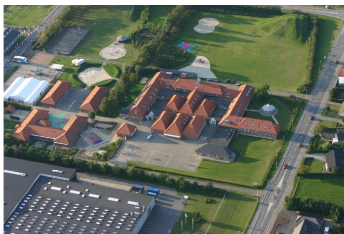
Tistrup skole 2009

Fra 2012 7-9. klasse fra Horne til Tistrup.