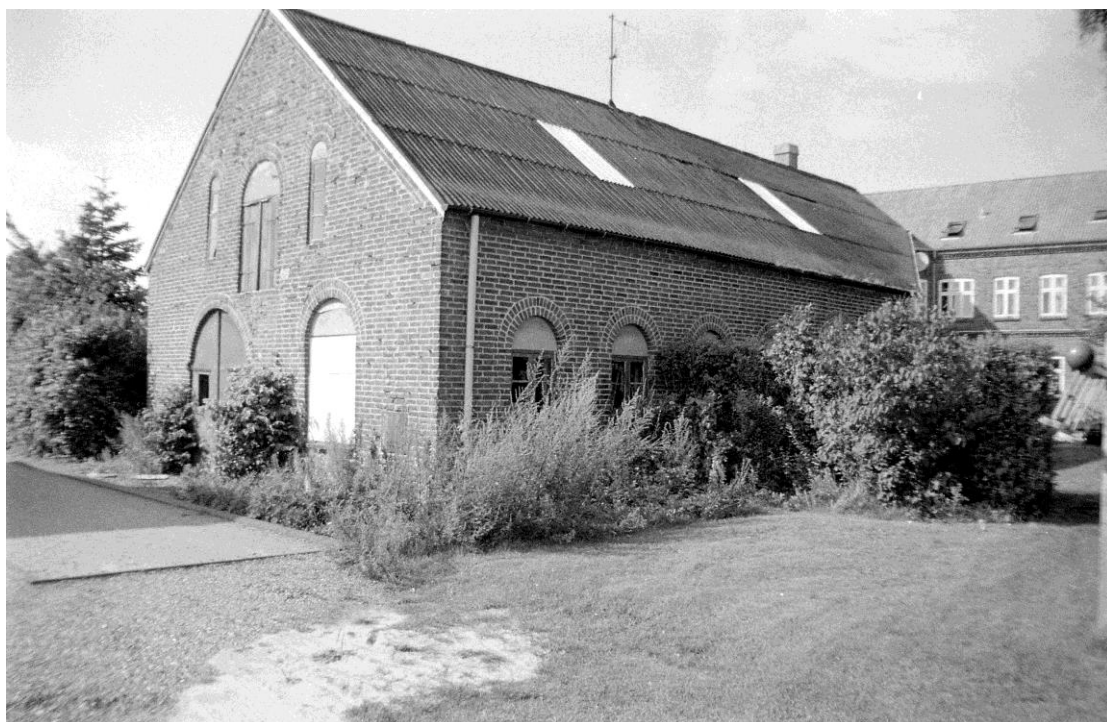
Jernbanegade 3. Tidligere bødkerværksted. Nedrevet