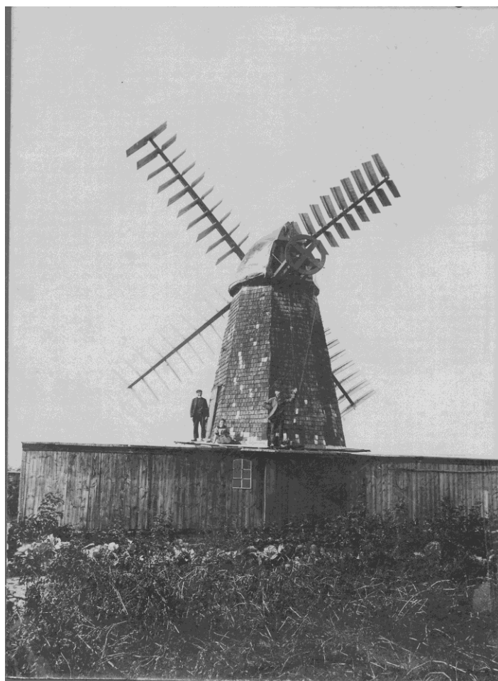
Benmøllen. Nedrevet. Benmøllen lå i Jernbanegades forlængelse, hvor indkørslen i dag er til Primo Plast.