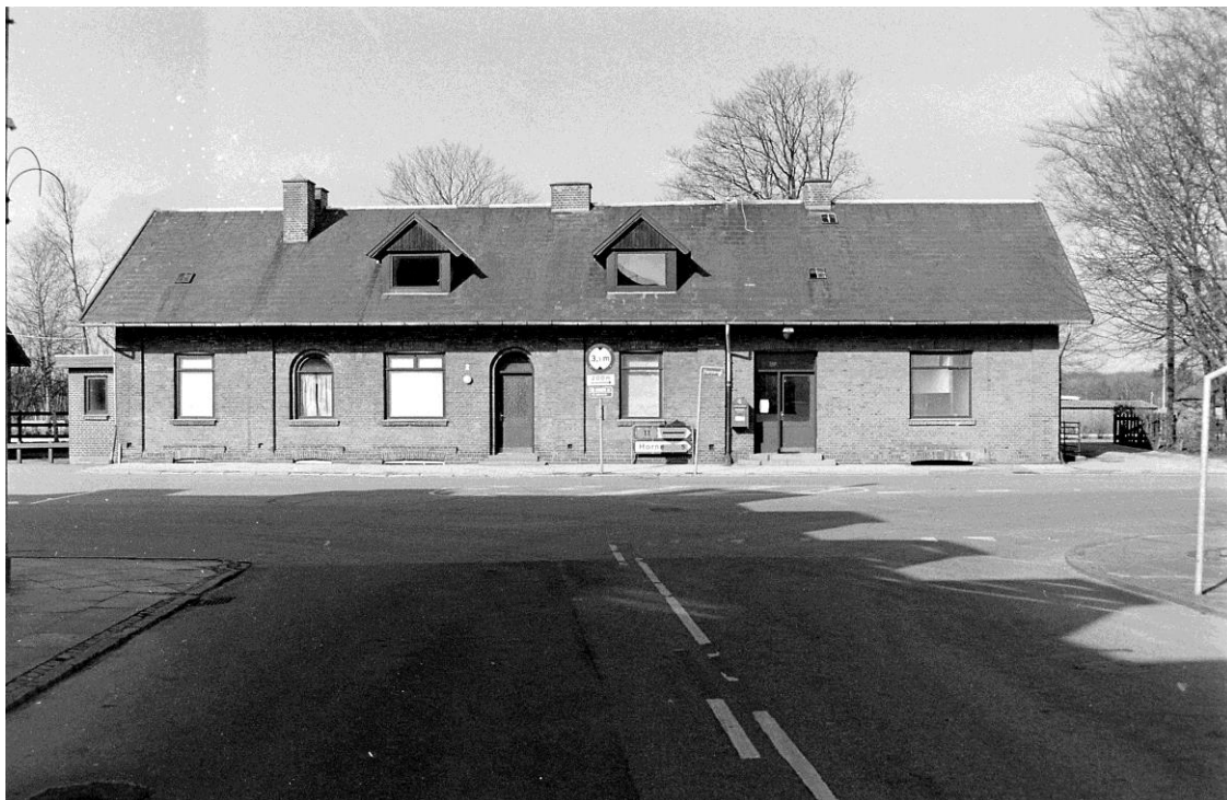
Tistrup station. Stationsbygningerne nedrevet i 2002